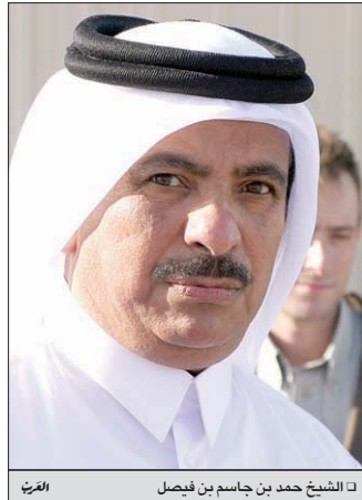
الشيخ حمد بن جاسم بن فيصل العرني

ويتوقع أن يشهد السباق التراثي منافسات كبيرة نظراً لقيمة الجوائز الكبيرة وأسم السباق نفسه